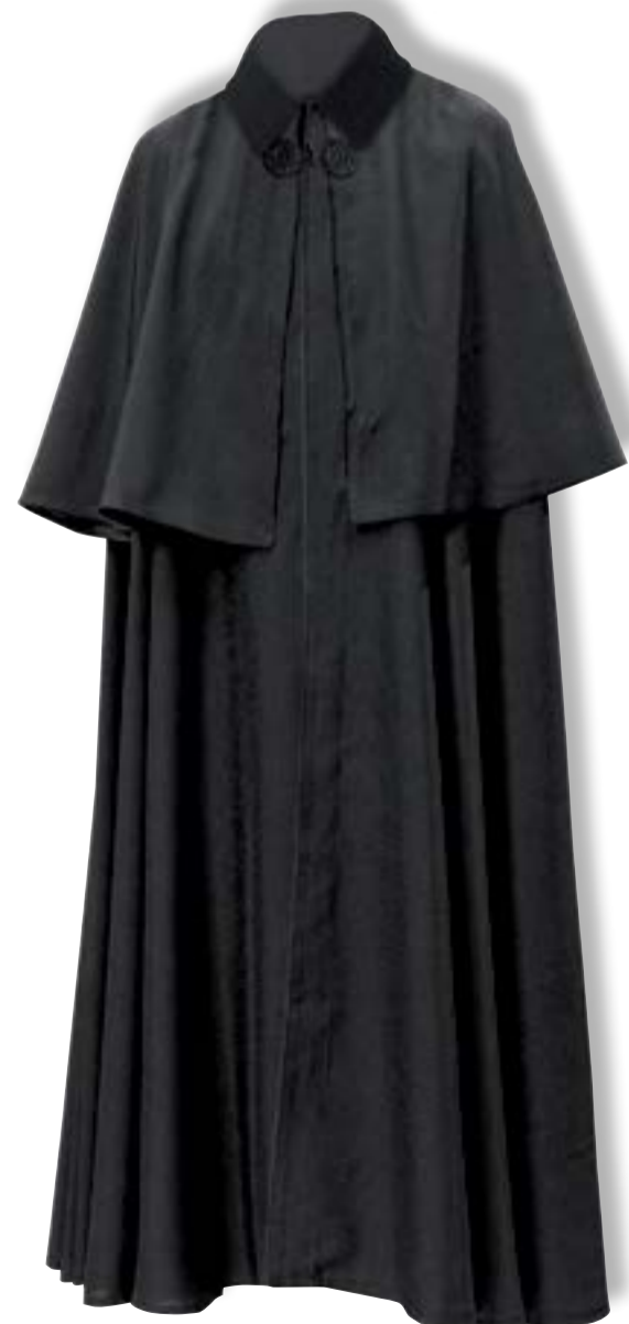
- Mantella nera a tutta ruota, in panno misto Cachemere, collo in velluto, alamari in seta, foderata in cotone sulle spalle. Completa di pellegrina, confezione sartoriale su misura. € 620,00 - Stessa mantella ma in panno lana pura. € 530,00