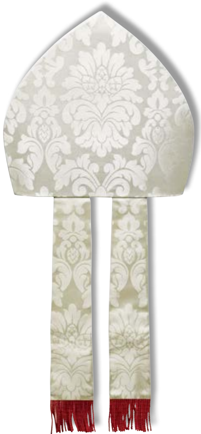
Mitria in damasco avorio con vitte terminanti con frangetta in filato rosso. € 280,00