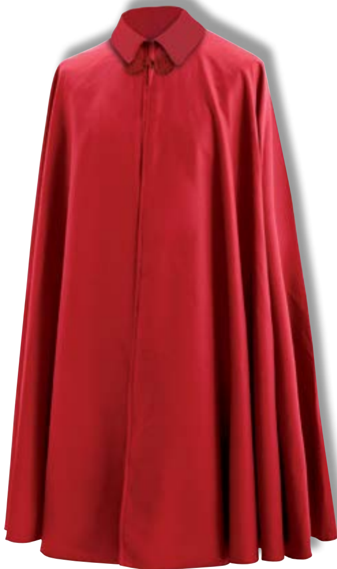
- Mantella per Abito Corale, lunghezza al ginocchio, in pura lana 100 %, collo in velluto, alamari in seta rossa o rossi e oro, foderata in cotone sulle spalle. Confezione sartoriale su misura. € 439,00